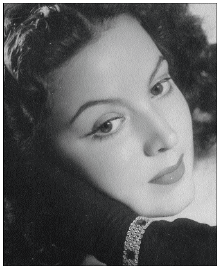
MARIADELOS ÁNGELES FÉLIX GUEREÑA

Desde que tengo uso de razón he oído hablar de la época del cine de oro de México. Mi padre vivió esa época y por eso hasta el día de hoy goza al ver cada una de las películas que hicieron historia en tan maravillosa época que me hubiera gustado vivir. Esa pasión que tiene mi padre por el cine de oro, me la transmitió y aunque no viví en aquellos años, también disfruto de cada una de las películas que trascendieron las barreras del tiempo alcanzando a varias generaciones. Sin lugar a dudas, una mujer que dejó huella en esta época fue María Félix, llamada la diosa del cine mexicano.